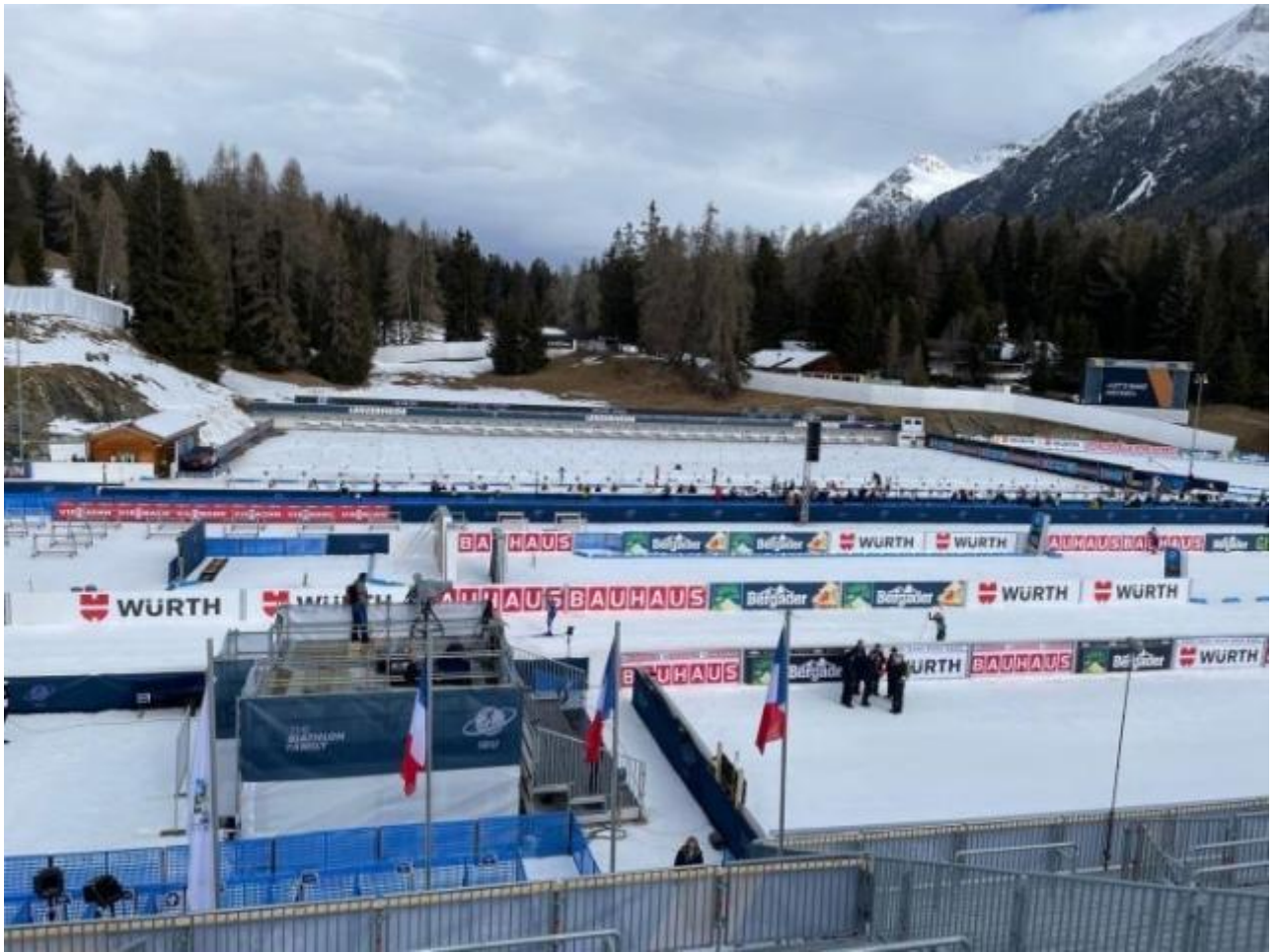
Wettkampfstätte in Lantsch/Lenz