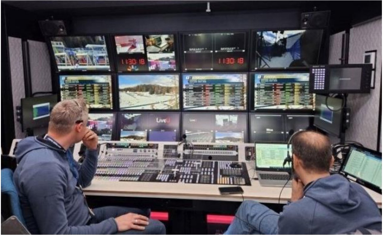
Broadcast: Regieraum des Schweizer Fernsehens SRF