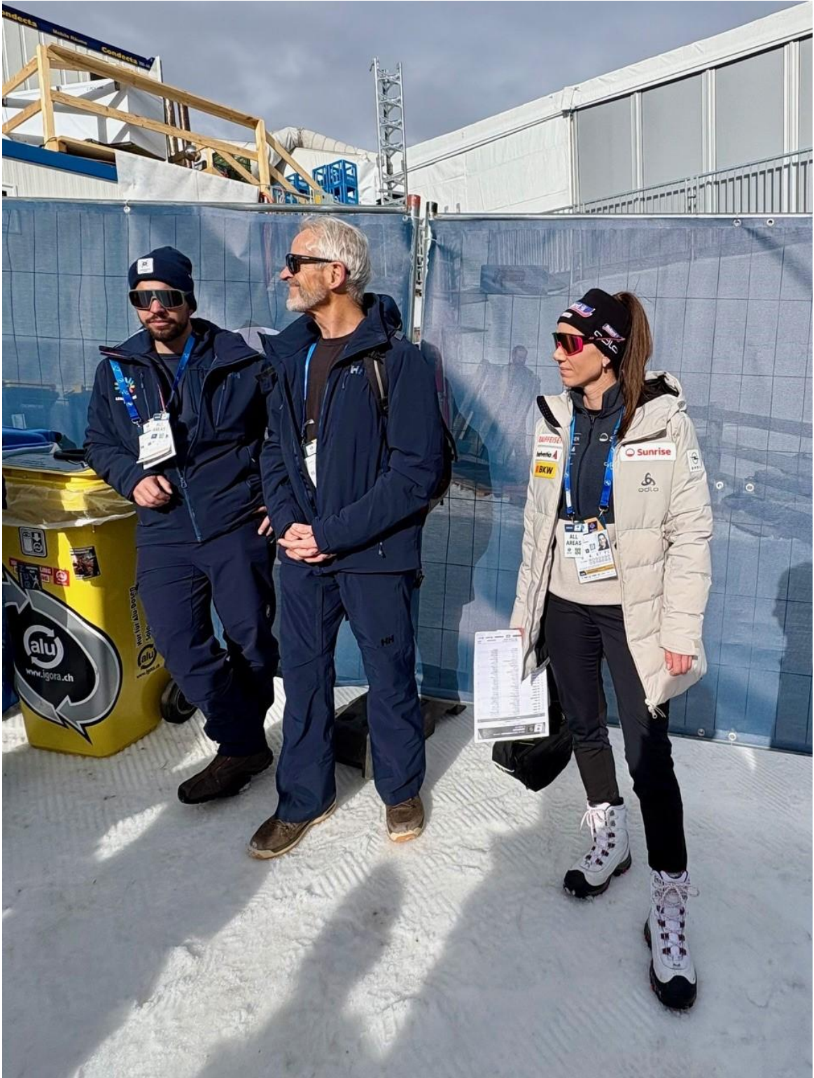
Olympia-Silbermedaillengewinnerin Selina Gasparin erklärt die Details des Biathlon-Sports