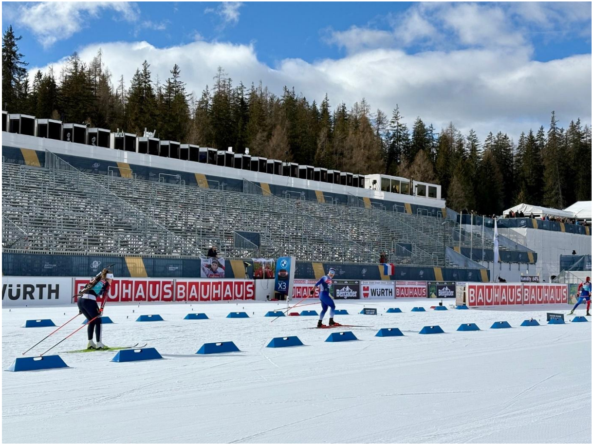
Wettkampfarena in Lantsch/Lenz