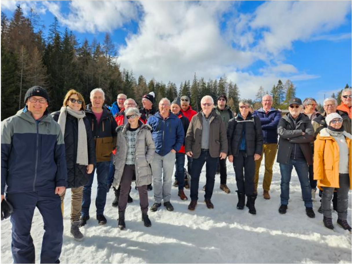
Panathletinnen und Panathleten an der Biathlon-WM Lenzerheide