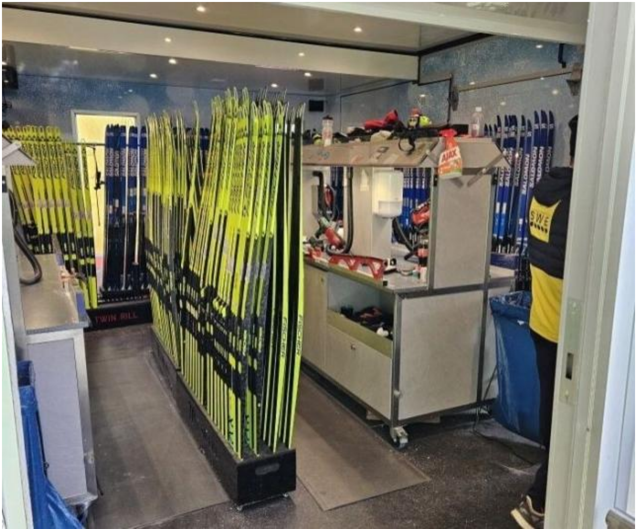
Wachsraum mit Ski-Depot