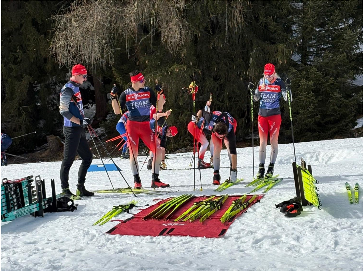
Schweizer Mixed-Staffel bereitet sich vor